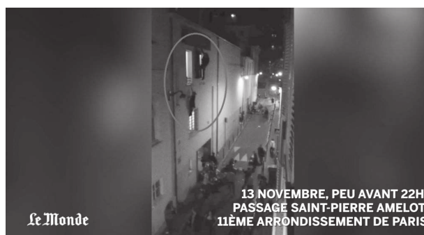
Fot. 2. Ludzie uciekający przed terrorystami

„Gazeta Wyborcza”, sięgając po materiały z mediów społecznościowych, starała się odtworzyć przebieg ataków (fot. 2.). Dzięki temu możliwe było wytworzenie emocjonalnej więzi między odbiorcą wiadomości a prezentowanym zdarzeniem czy ofiarą ataku. Wydaje się, że na tej podstawie, podobnie jak miało to miejsce w przypadku nagłówków, chciano wzbudzić w czytelniku zainteresowanie tema-